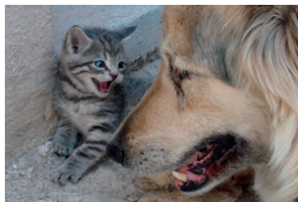
Hund & Katz Cane & gatto Dog & cat

An einer Hangkante steht seit zwei Jahren das bunte Bienenhaus. Den Honig gibt es im Laden. Die Vielfalt an Pflanzen, die es mittlerweile hier wieder gibt, ist ein Schlaraffenland für Bienen. Auch fremde Bienenvölker verbringen die Saison zwischen den Rebzeilen. Ebenso gern genutzt werden die Nistkästen für die vielen Vogelarten rund um den Kalterer See.