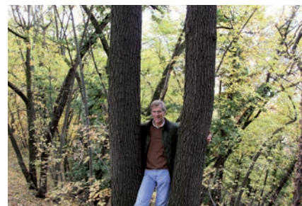
Unser Eichenwald Il nostro bosco di querce Our oak wood

Today nobody believes anymore in the laissez-faire and hands-off attitude which characterised the beginnings of biological agriculture. In fact the exact opposite is required: intensive hard