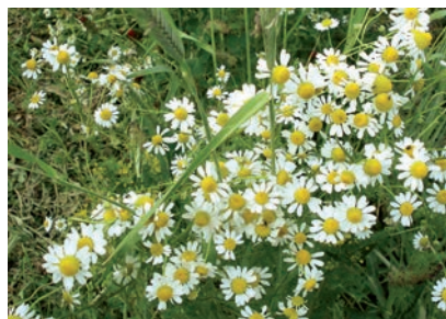
Kamille im Weinberg Camomilla nei vigneti Camomile in the vineyard

A recovery phase. Towards the end of August everything was going fine again and if the weather played along, the prospects for a really good harvest seemed good. The ripening phase, the most important stage in determining the quality of the grapes, went ahead at full tilt. We stimulated this delicate transition in the formation of aromas using horsetail tea and cow's horn silica preparation. The secret of achieving top quality lies in preventing the vine from expending its resources on growth and producing foliage, to enable it to concentrate them on ripening the grapes to maximise the build-up of aroma substances.