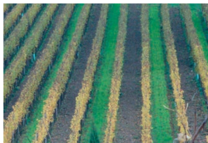
Einsaaten für die Böden Inerbimento nel vigneto Cover plants for our soils

However, there was plenty of persuasion work to be done in the estate. The concept of biodynamic husbandry only works when it is supported by an inner attitude towards nature. When biodynamic methods were introduced the older workers were the least convinced. “Count, do you really want to let everything go to rack and ruin?” The 80 year-old has been working at Manincor for 65 years and even today he never misses a day's work. Then, after the first successful biodynamic harvest, he opined: “That's how we used to do it”. Of course vineyards “used to” be worked with animals, compost was made and people paid attention to the rhythms of nature and moon cycles.