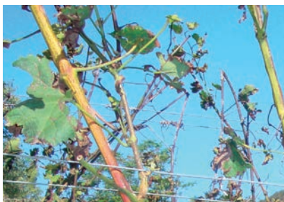
Nach dem Hagel Dopo la grandine After the hail

sul piano climatico vi erano di nuovo le migliori prospettive per un'annata veramente buona. Si poteva entrare così nella fase della piena maturazione, la più importante per la qualità delle uve. Abbiamo stimolato questo difficile passaggio per la costruzione delle qualità gustative con tè di equiseto e preparato biodinamico a base di corna con silicato. Il segreto per una qualità eccellente è ridurre quasi a zero la crescita per massimizzare invece la formazione degli aromi.